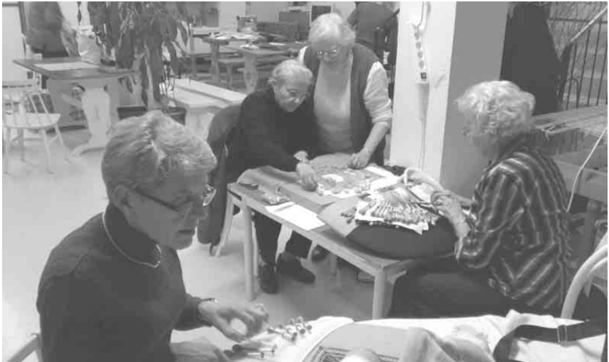
Kalevantiellä opetellaan tiistaisin nypläystä pienellä porukalla.