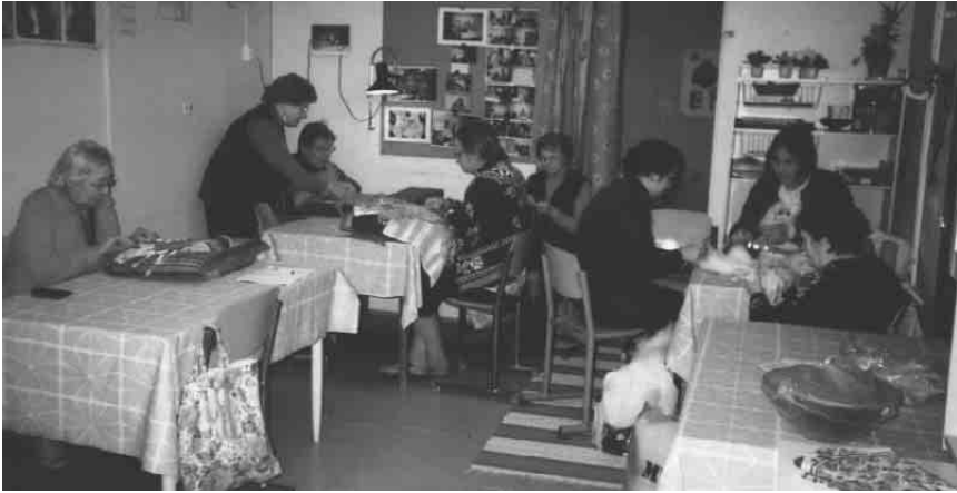
Nyplääjiä työn touhussa nypläyskerhon 25-vuotisjuhlapäivänä Ilpoisten kerholla.

80-luvun puolivälissä käytiin ahkerasti antamassa nypläysnäytöksiä erilaisissa tapahtumissa. TKY:llä oli mm. oma osasto Terveysmessuilla ja Turun Messuilla monena vuonna.